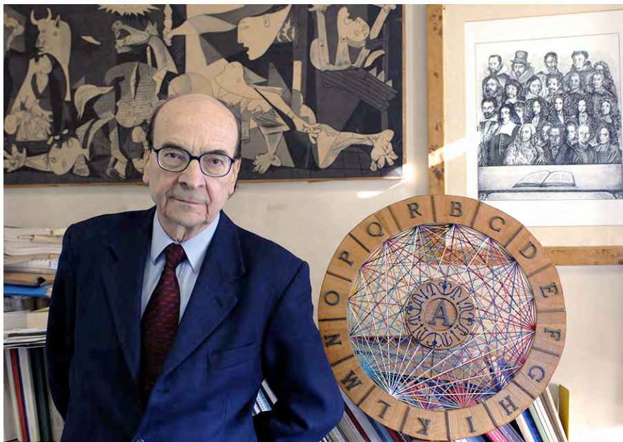
Figura 1: Tullio Gregory all'ILIESI.

Il Lessico Intellettuale Europeo (LIE) è nato nel 1964 come Gruppo di ricerca. È poi divenuto Centro di Studio nel 1970 e infine nel 2001 Istituto per il Lessico Intellettuale Europeo e Storia delle Idee (ILIESI) del Consiglio Nazionale delle Ricerche. Tullio Gregory ne è stato non soltanto il fondatore: è stato l'ispiratore delle linee di ricerca, il promotore delle iniziative scientifiche, l'ideatore del progetto filosofico intorno al quale si è incentrata la gran parte delle attività dell'Istituto. Su questo progetto si sono formate generazioni di ricercatori, che hanno contribuito, seguendo itinerari diversi, allo sviluppo degli studi storico-filosofici.*