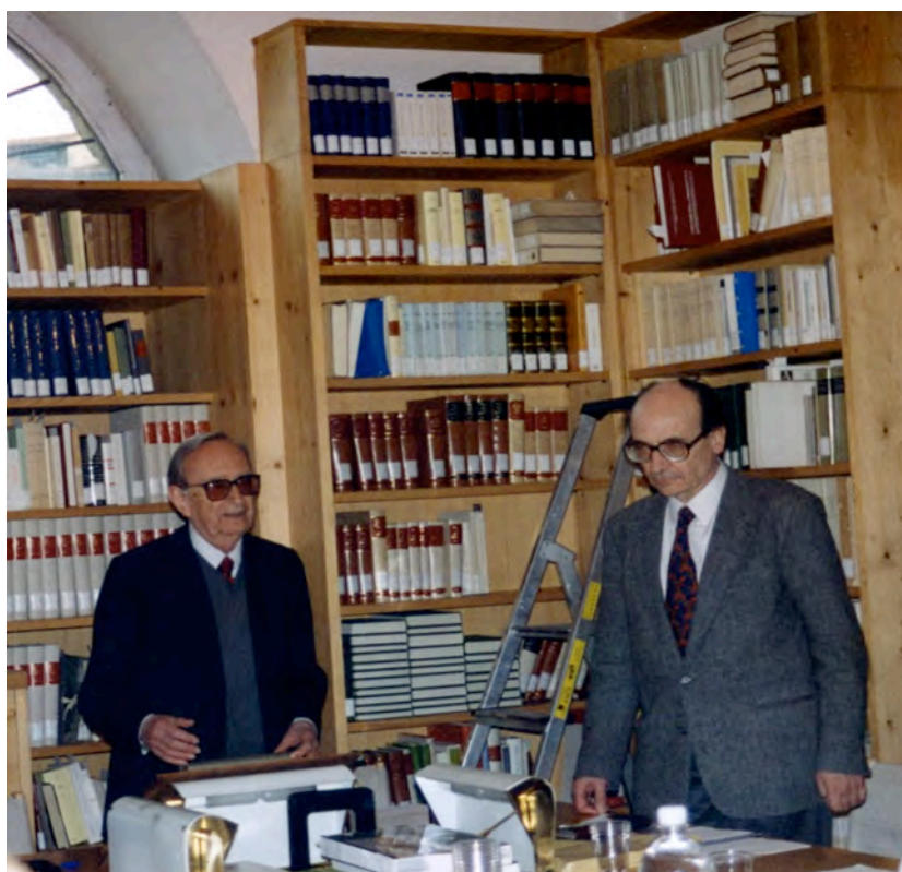
Figura 3: Tullio Gregory con Eugenio Garin a Firenze nel 1989.

comporta sempre il trasferimento di un'eredità culturale da uno ad altro contesto geografico e linguistico, la traduzione ha, come la scrittura, "un'origine divina" e compie "una missione salvifica" trasmettendo e riformulando simboli, categorie e valori, ridisegnando periodi di crisi e epoche di rinascite. In questo senso, scriveva Gregory, la traduzione "prolunga nel tempo e nello spazio la vitalità di un testo, assicura e rinnova una tradizione", 9 rispondendo alla necessità di ogni cultura di trasferire o di trascrivere modelli teorici ed esperienze di pensiero di cui avverte la necessità o si ritiene in qualche modo carente.