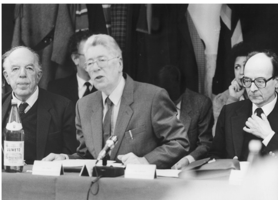
Figura 2: Ernst Gombrich, Paul Dibon e Tullio Gregory al Convegno su “Storia delle idee: problemi e prospettive”, Roma, 29-31 ottobre 1987.

È in quelle epoche, secondo Gregory, che l'umanità è costretta a riformulare i propri riferimenti intellettuali, a reinventare e a ricostruire la propria identità culturale. È in quei momenti che si attuano le trasformazioni decisive e si stabiliscono le basi per future evoluzioni.